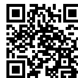
連絡メール2 保護者ログイン

* 保護者登録しているメールアドレスがご利用できない場合は、パスワードの再設定ができません。